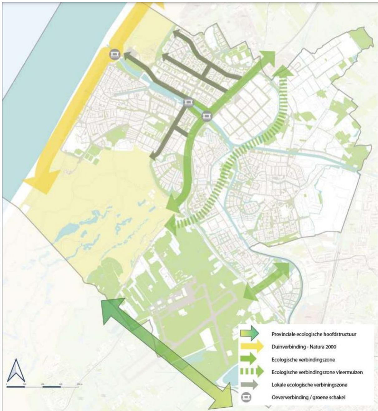
Figuur 1 Groenbeleidsplan 2020-2029 Katwijk.

(Park/plantsoen Bosplein en Kon. Julianalaan aangemerkt als lokale ecologische verbindingzone).